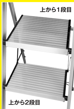
DF-4T 上から1段目 使用イメージ