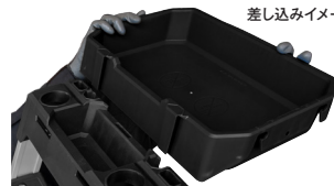
差し込みイメージ