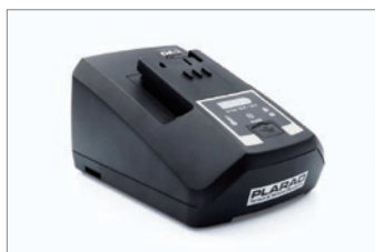
標準付属：100V 充電器付き フル充電時間 約40分