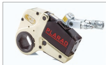
油圧トルクレンチ VS型