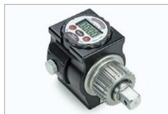
オプション：STトルクメーター 3機種 測定範囲：110Nm～5500Nm 1Nm単位で締付トルクを高精度測定