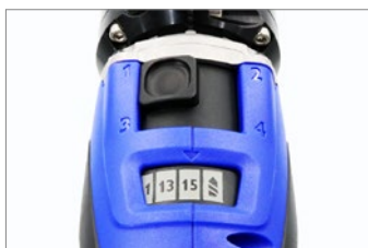
トルク設定 60段階： 4ギア×15ステップ 緩めパワーモードもあり