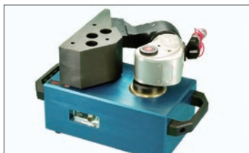
トルク検定・校正サービス

3機種：19口、25.4口、38.1口用、 測定範囲：110Nm～5500Nm 1Nm単位で締付トルクを高精度測定。