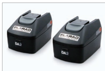
標準付属：大容量リチウムイオン バッテリー 2個付き