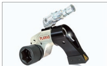
油圧トルクレンチ SC型